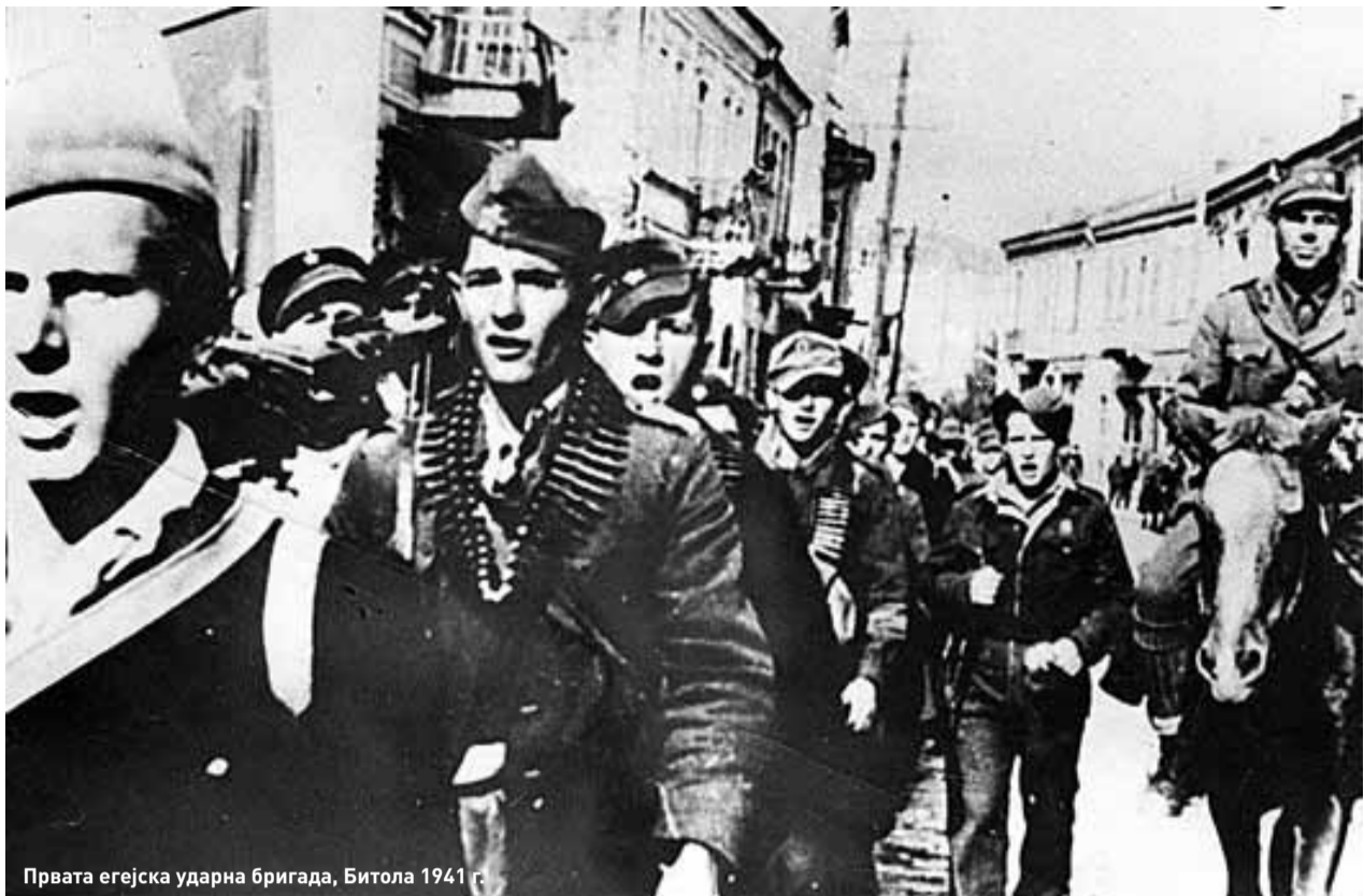
Првата егејска ударна бригада, Битола 1941 г.

Во источна грчка (Егејска) Македонија, источно од реката Струма (Стримон), Бугарите биле безмилосни спрема Грците, кои дотогаш веќе претставувале мнозинство таму. Како што видовме погоре, по балканските војни и по Големата војна, грчката власт присилно ги раселила од тоа подрачје Македонците, тамошните слагоговорни жители. Поголемиот број ги протерале