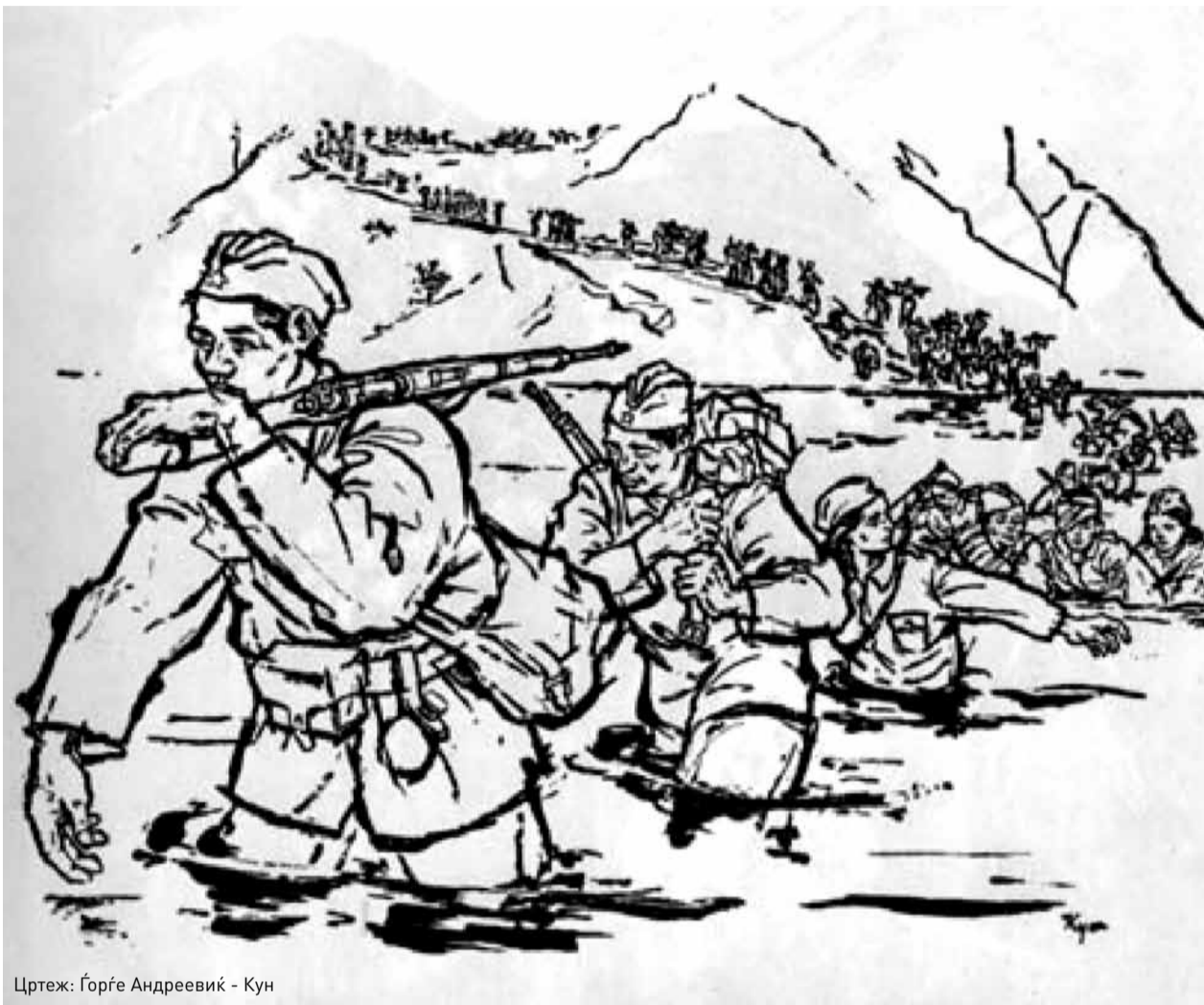
Цртеж: Горѓе Андреевиќ - Кун

1) Народно-ослободителните партизански одреди во сите области на Југославија – Србија, Хрватска, Словенија, Црна Гора, Босна