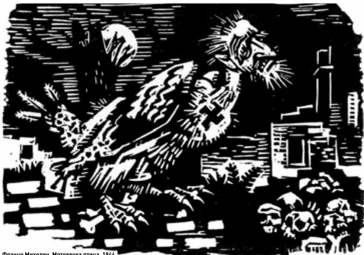
Франце Михелич, Мртовецка птица, 1944