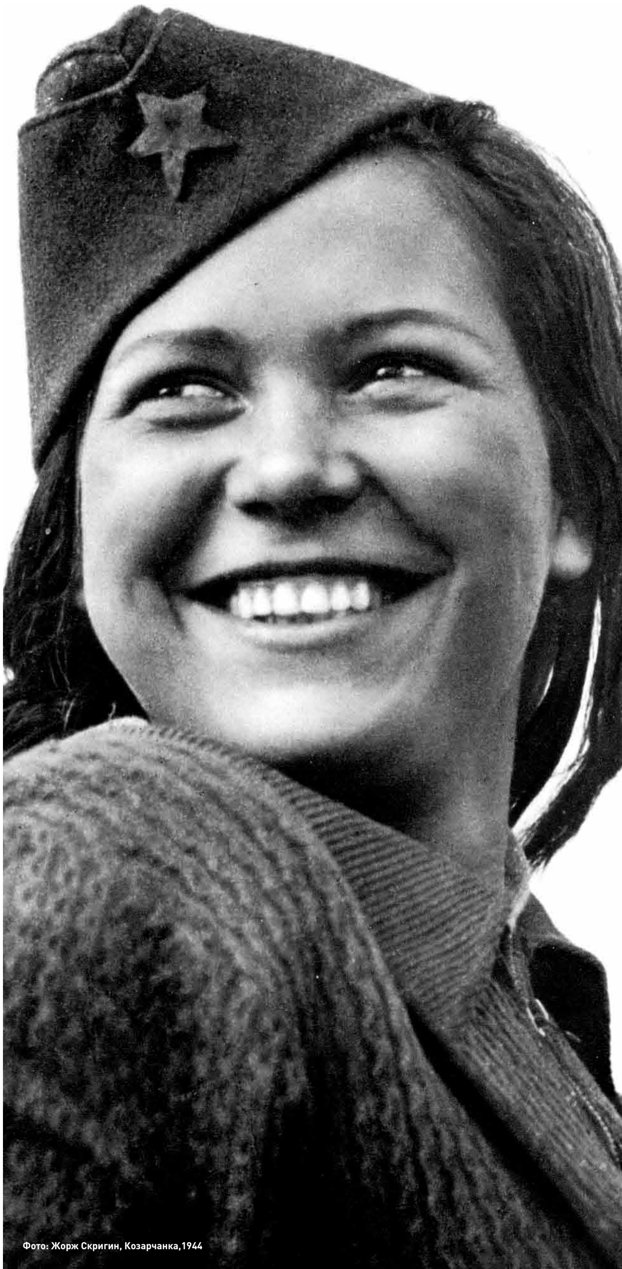
Козарчанка, 1944