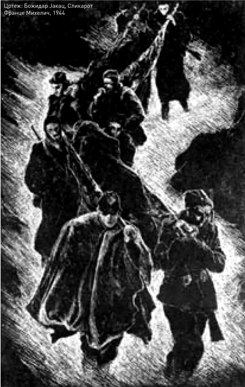
Цртеж: Божидар Јаќац, Сликарот Франце Михелич, 1944