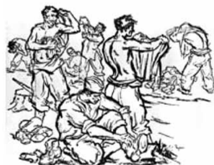
Цртеж: Горѓе Андреевиќ - Кун

2) Најголемиот непријател на слободата и независноста на нашите народи е германскиот фашизам, па потоа сите останати негови фашистички трабанти, кои пустошат низ нашата земја. Според тоа, света должноста на сите родољуби е немилосрдно да се борат до целос-