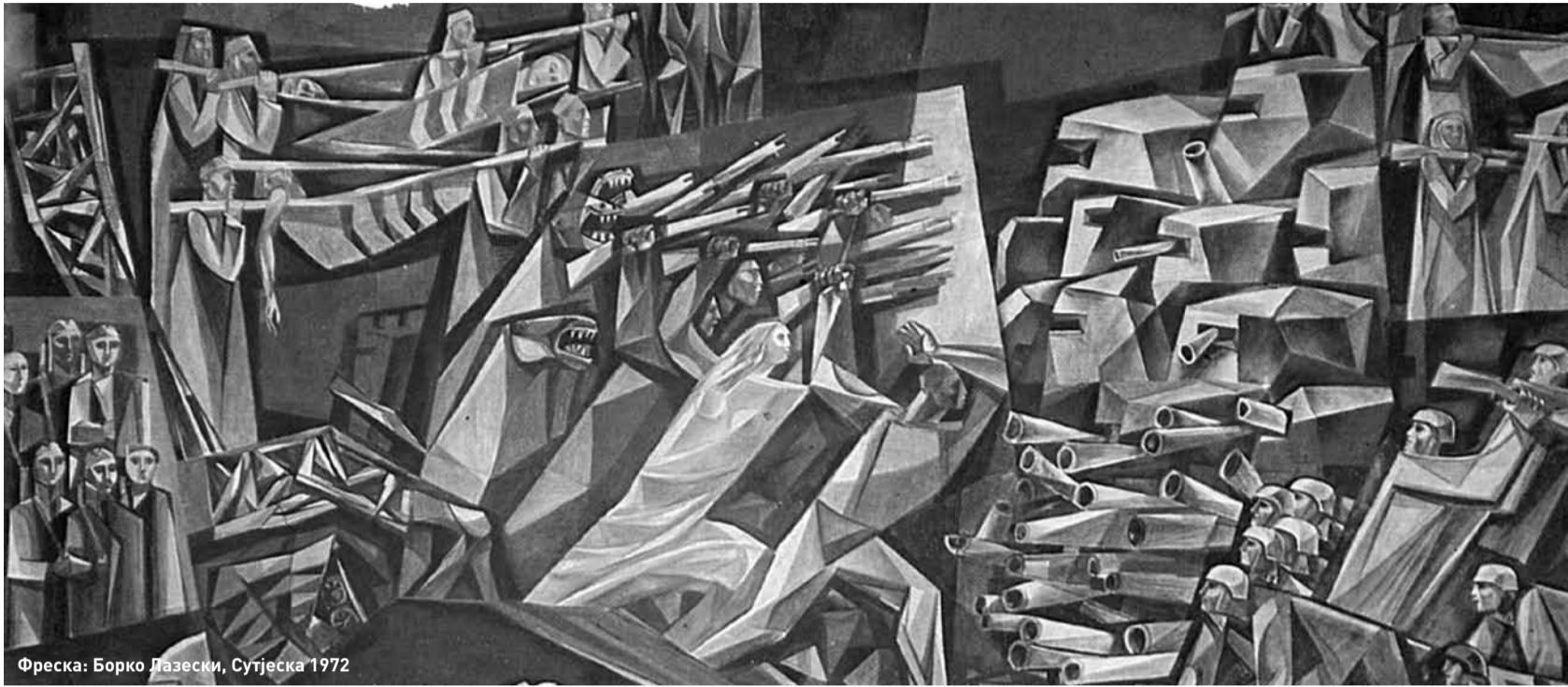
Фреска: Борко Лазески, Сутјеска 1972