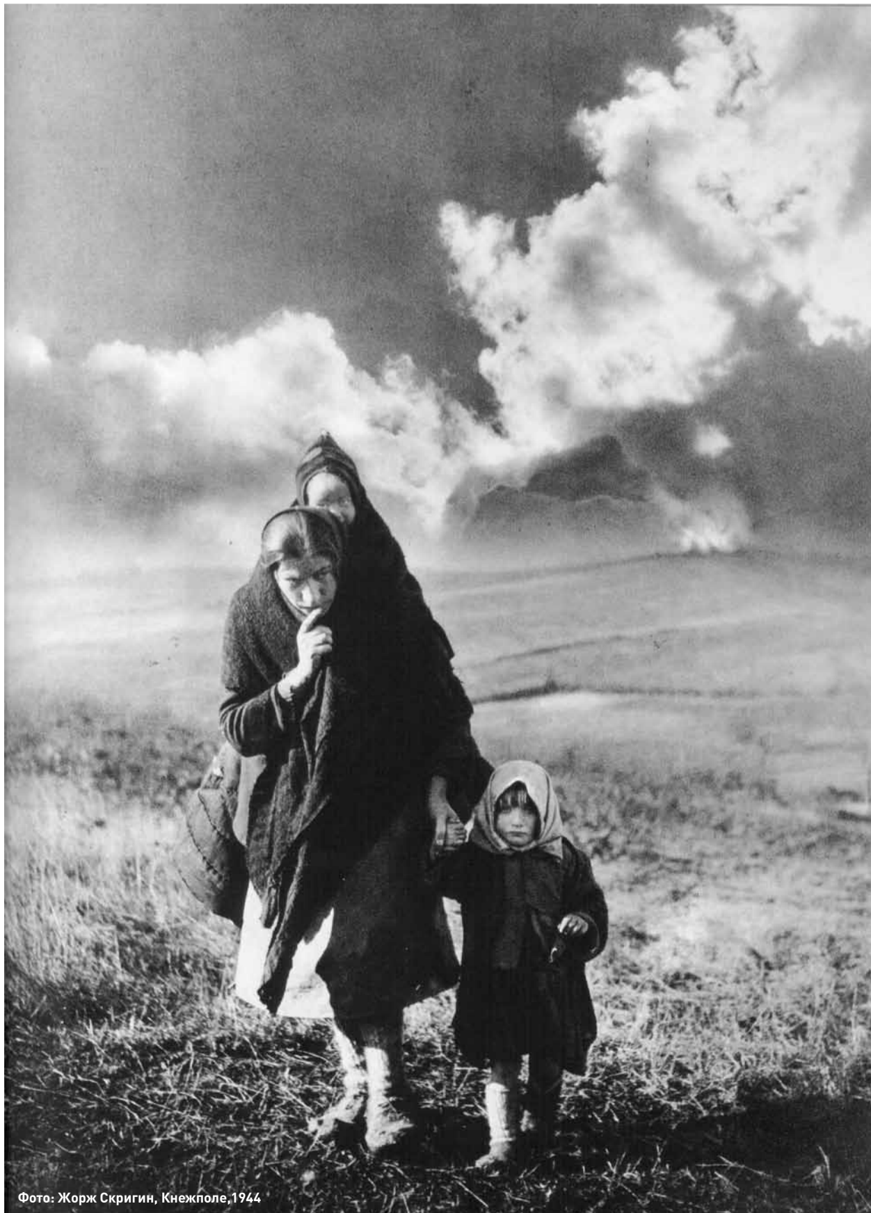
Фото: Жорж Скригин, Кнежполе, 1944

Од почетокот на војната, Македонското прашање не било само српско/југословенско прашање, туку ги засегаало и грчка и бугарска Македонија и соседните држави. Првото заседание на АСНОМ во август 1944 година и тогашното формално основање на македонската република во рамките на Југославија имале далекусежни реперкусии низ целиот Балкан, но