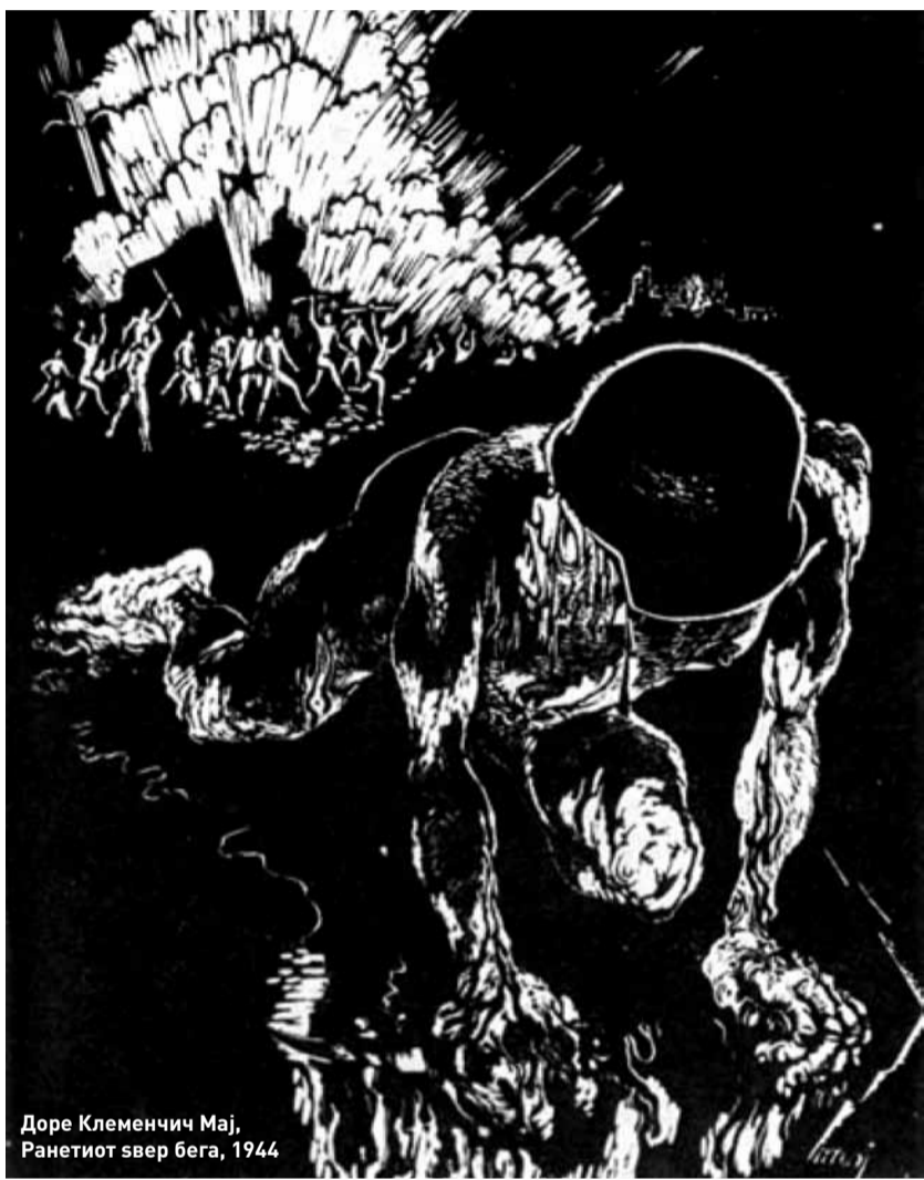
Доре Клеменчиќ Мај, Ранетиот звер бега, 1944

Традицијата е заборавање на потеклото. Maurice Merleau-Ponty